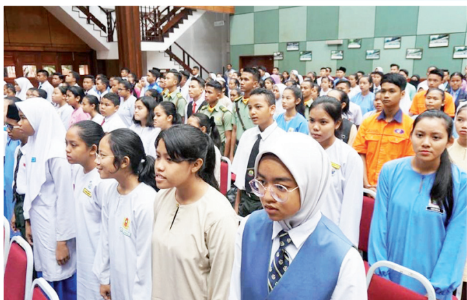
Antara murid orang asli yang akan meneruskan agenda pembangunan negara pada masa depan.