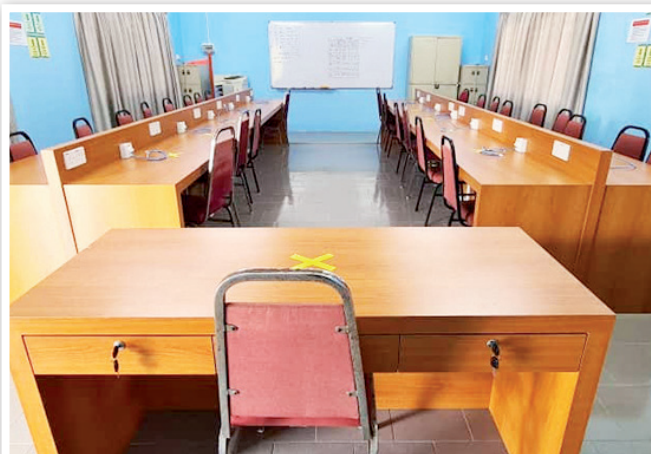
Suasana tempat murid yang kondusif, selesa dan bersih.