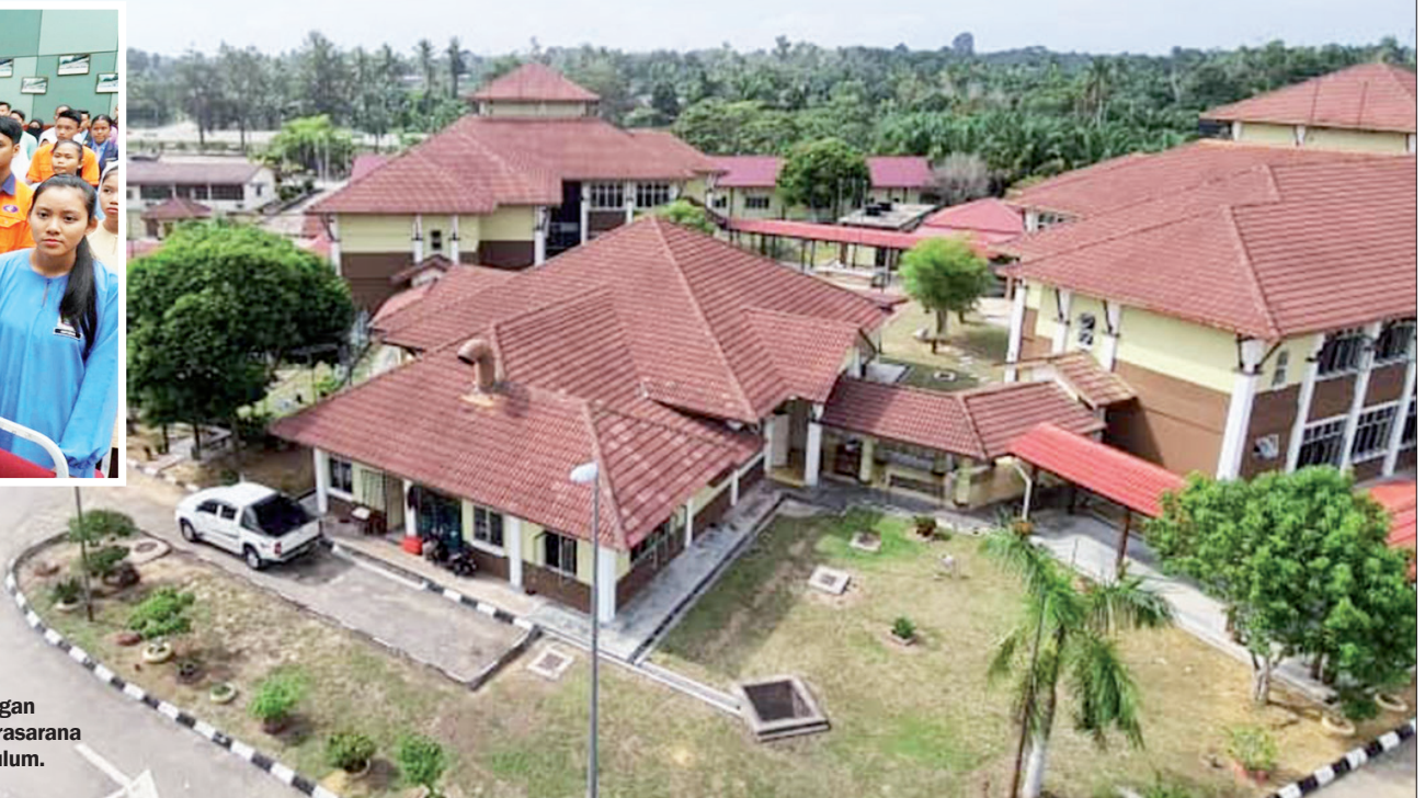
PIPOA dilengkapi dengan kemudahan asrama dan prasarana untuk aktiviti ko-kurikulum.