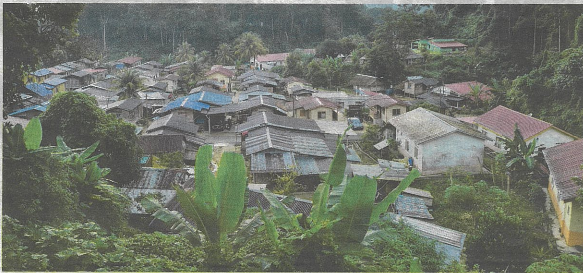
PENEMPATAN baharu penduduk di Pos Dipang yang dibina selepas tragedi banjir lumpur 24 tahun lalu.

sebelum tragedi banjir lumpur, penempatan Pos Dipang hanyalah sebuah penempatan biasa dengan kebanyakan rumah penduduk merupakan rumah tradisional.