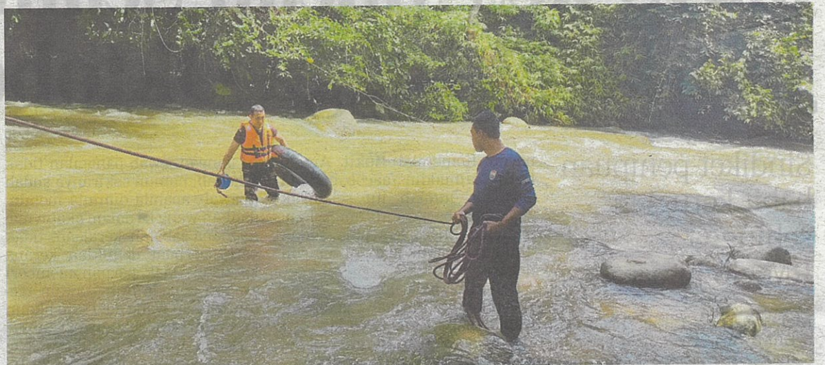
Sungai Slim menjadi sumber ekonomi kepada penduduk setempat wajar dipelihara.

Saharudin berkata sungai adalah warisan khazanah alam semula jadi yang mempunyai kepentingan dalam kehidupan ma-