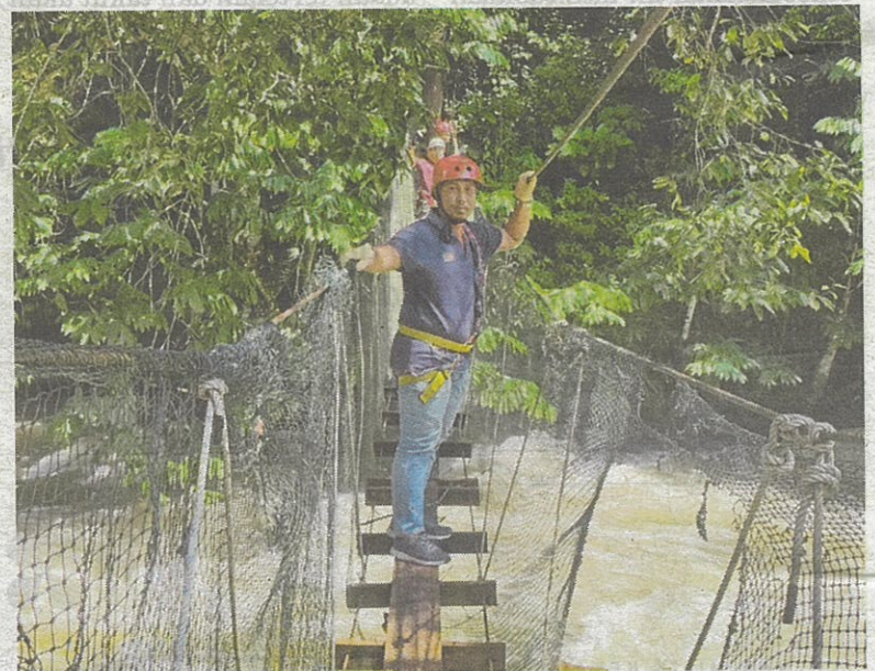
Kemudahan jambatan gantung yang disediakan kepada pengunjung di Sungai Slim.

Katanya, sementara sungai belum dicemari dan boleh menjana ekonomi semua pihak perlu memelihara sungai bukan hanya untuk hari ini tetapi untuk generasi akan datang.